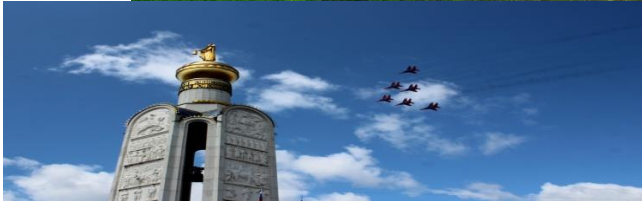
Звоница в Прохоровке.