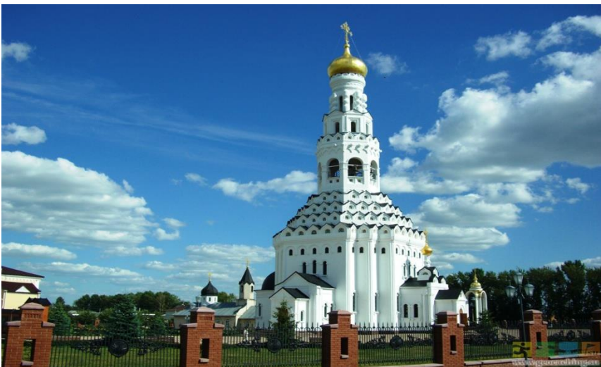
Храм святых Петра и Павла в Прохоровке.

-Правильно, красного от крови. На этом поле 12 июля 1943 года произошло грандиозное танковое сражение. Горели небо и земля, плавился металл, все было окутано черным угарным дымом. Наши бойцы и командиры проливали кровь за любимую Родину, освобождали страну от фашистских захватчиков. Такого по массовости сражения до этого не было в истории. Наши войска в кровопролитной битве одержали победу над немцами. Позже Прохоровское поле стали называть Третьим полем воинской славы России. А знаете, какое было первое и второе поля воинской славы? Первое-поле Куликово, второе - Бородинское, а третье-Прохоровское. На Прохоровском поле, где шли бои, в мирное время построили храм Петра и Павла. При входе в него на плитах золотом высечены имена всех участников этого танкового сражения. Есть Звоница и мемориальный комплекс.