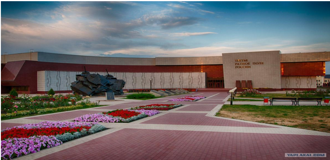
Мемориальный комплекс «Прохоровское поле».

-Ребята, с победой на Прохоровском поле Великая Отечественная война еще не окончилась. Было еще много битв в нашей стране и за ее пределами.