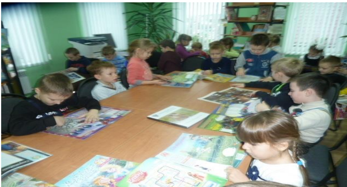
Воспитанники детского сада комбинированного вида «Теремок» в читальном зале библиотеки.