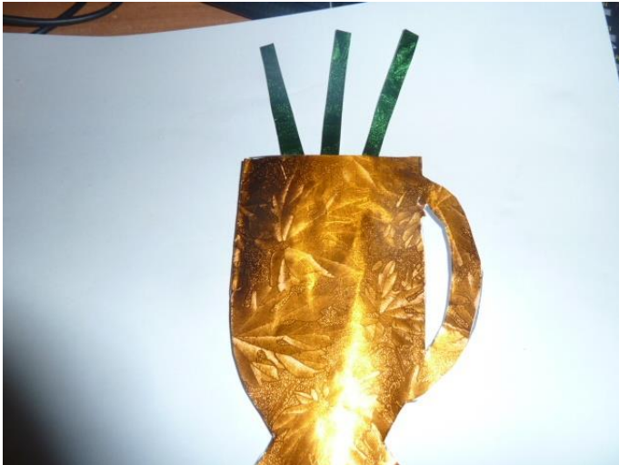
5. Из фольги вырезаем цветы.